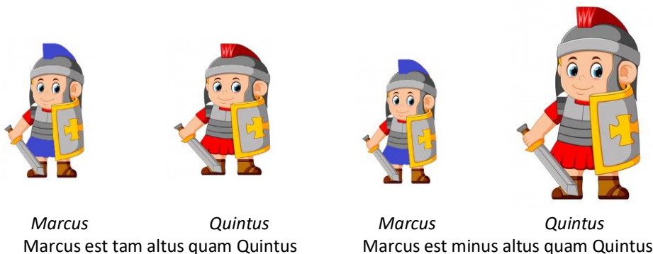
Figura 1: Comparativos de igualdad y de inferioridad